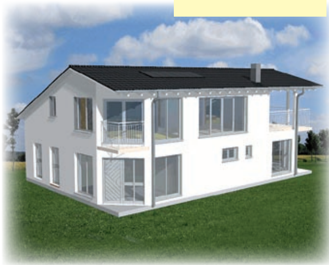
Das neue Sanitärgebäude mit der Rezeption

In der Nebensaison gewähren wir 10 % Ermäßigung auf die Stellplatzgebühr